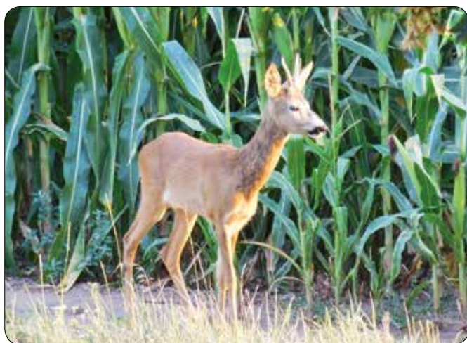
Zvěř v naší honitbě