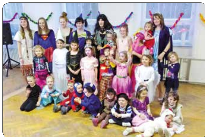
Foto z maškarního karnevalu