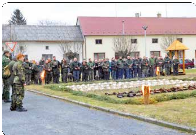
Závěrečný výřad po honu