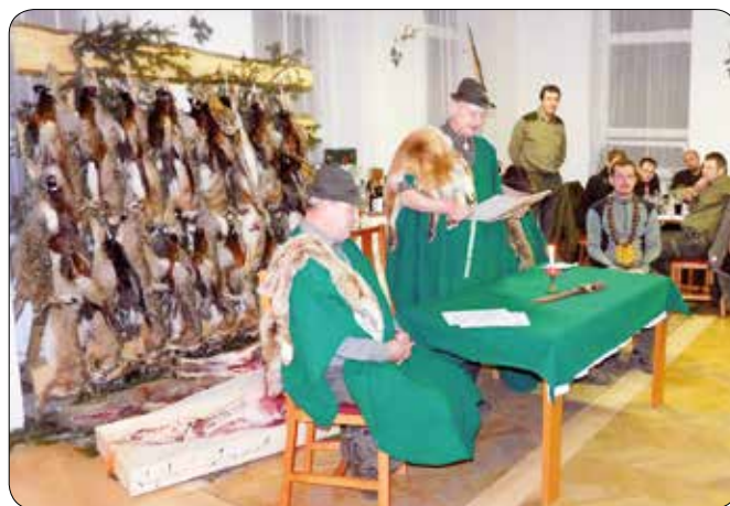
Čestný myslivecký soud na „poslední leči“