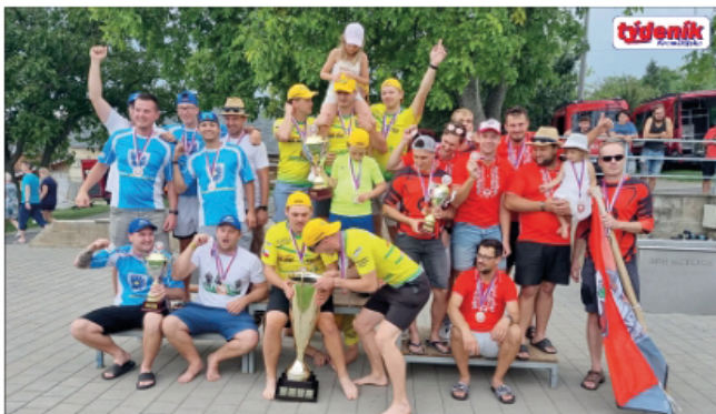
Vítězná trojice týmů Zahnašovic (ve žlutém), Karolína (v modrém) a Křenovic (v červeném)