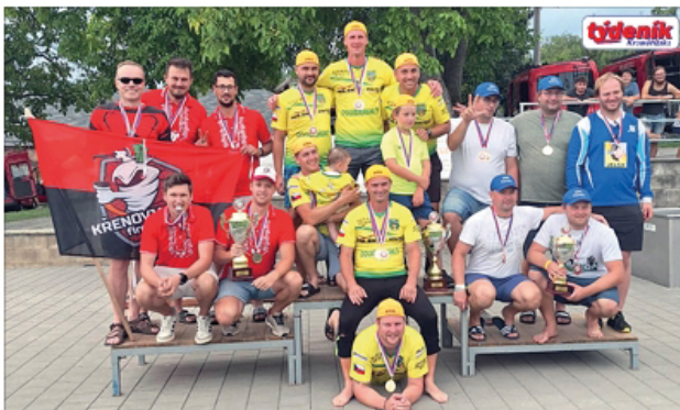
Tým SDH Zahnašovice vyhrál i v kategorii nad 35 let.